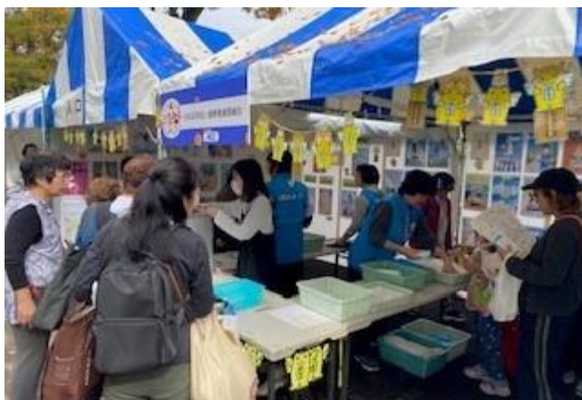
くみんの広場 テント出店での啓発活動の様子

毎年秋に代々木公園で行われる「渋谷くみんの広場」では、明るい選挙推進委員会として参加して、区内の子どもたちが描いた選挙啓発ポスターコンクールの作品展示や表彰式を実施しています。