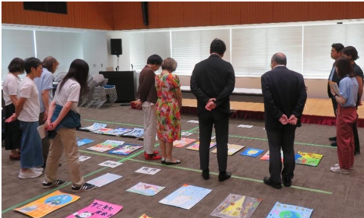
ポスターコンクール審査会の様子

渋谷区内の各地区では、それぞれの地域で活動されている推進委員のみなさんが地域のイベント・お祭りなどに参加して、啓発物の配布などを通じて投票への参加の呼びかけ等を行っています。