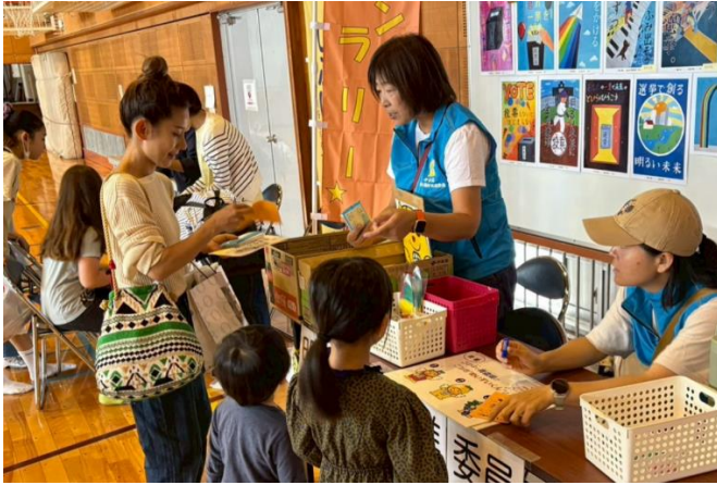
西原地区の推進委員のみなさん