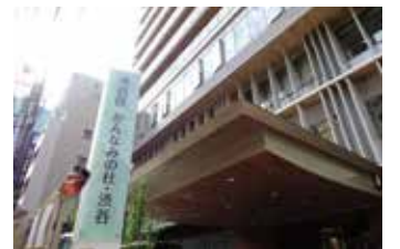
▲かなみの杜・渋谷

区初となる「看護小規模多機能型居宅介護事業所」や「認知症高齢者グループホーム」などを併設する「恵比寿西二丁目複合施設」、および「特別養護老人ホーム」や「デイサービス事業所」を擁する「かなみの杜・渋谷」の2施設については、無事にオープンを迎え、順次利用が始まっています。皆さまから愛され親しみを持っていただけるよう、運営事業者と共にしっかりと取り組んでいきます。