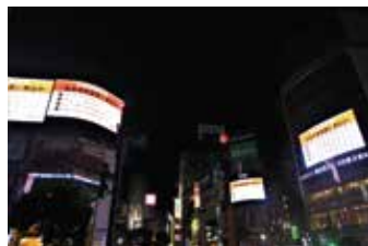
▲スクランブル交差点