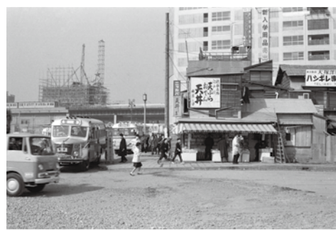
▲昭和35年 整備中の渋谷駅西口付近