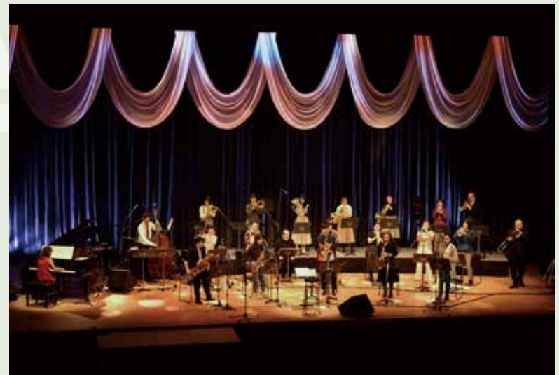
▲前回の公演の様子