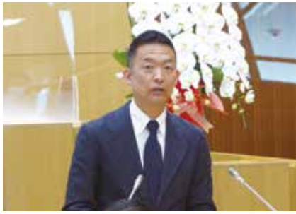
▲6月2日 令和3年第2回区議会定例会