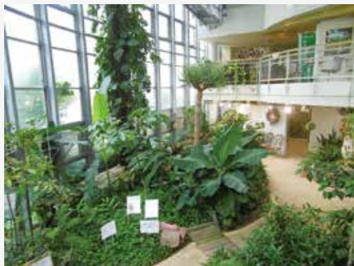
▲ふれあい植物センター館内