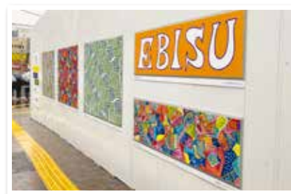
▲工事現場の仮囲い

ライラ：「産官学福」の連携によって、事業化しているシブヤフォントは世界的に見ても先進的な取り組みだと思います。区民の皆さんには、自分の街からこんなに面白いアートとデザインが生まれているんだということを知って興味を持ってもらいたいですし、シブヤフォントを通じて、街への誇りを感じていただけたらうれしいです。