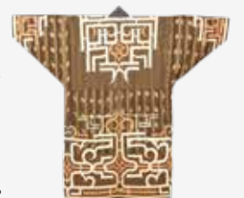
▲木綿衣(チウカウカフ) 19世紀 東京国立博物館蔵

📅 6月26日(土)~8月9日(月・休) 📍 2020年に北海道白老町に国立アイヌ民族博物館が開館しました。それを記念し、アイヌ民族の服飾文化を紹介します。樹皮衣、草皮衣といったその素材の多様性や、ルウンペ(色裂置文衣)、カパラミョ(白布切抜文衣)などに見られるアイヌの意匠を通して、華やかで独自の文様が施されたアイヌ民族のハレの日の着物を紹介します。