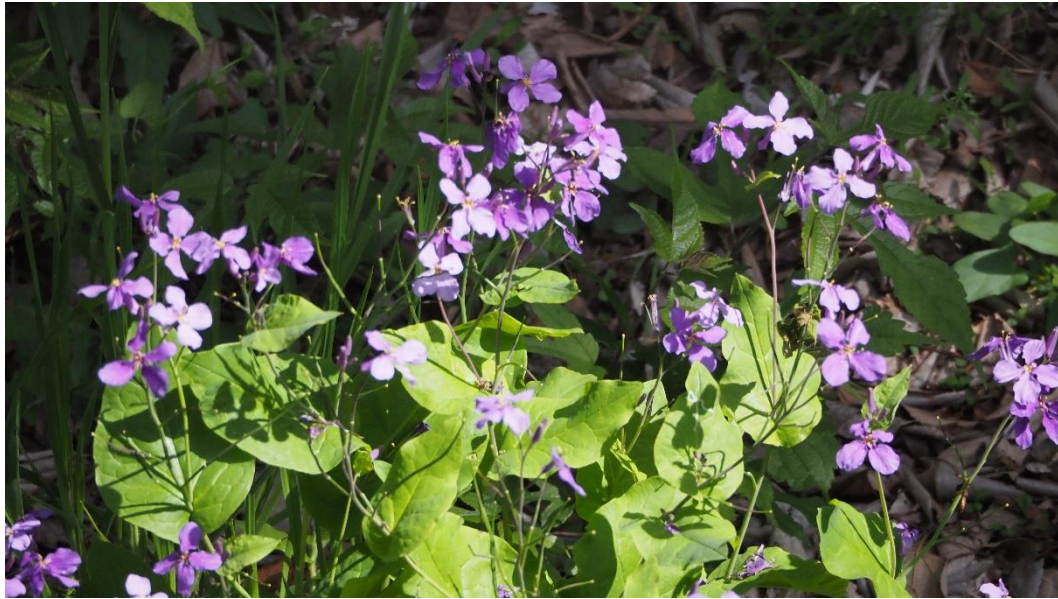
オオアラセイトウ (別名 諸葛菜) 2026年 4月18日 撮影

参考：諸葛孔明が「沃野千里・天府の地」と讃えた中国四川省都江堰市の古代水利工取水堰と、「都江堰灌漑区域図」。灌漑エリアは、四川省の拠点、成都に至る。