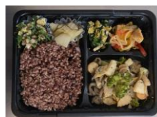
普通食825円〜 おかずのみ770円〜