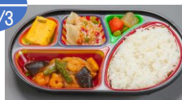
普通食 (おかずとごはん)610円