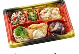
まごころおかず740円

※1食あたりの栄養素は平均値です、内容により栄養素の値は前後する場合があります。