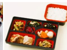
まいにち七菜 ごはんセット720円