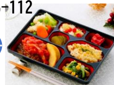
まいにち七菜 おかずのみ620円