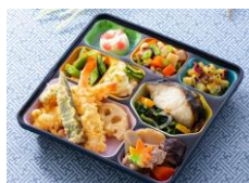
こだわり八菜 おかずのみ780円