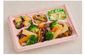
ワタミdeおいしい健康 740円