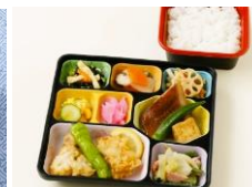
こだわり八菜 ごはんセット880円