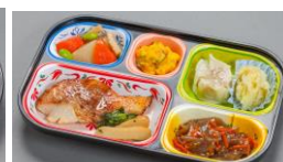
普通食 (おかずのみ)560円