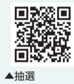
▲抽選申込フォーム