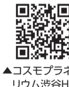
▲コスモプラネタリウム渋谷HP

少年時代に出会った彗星探査家の本田貴氏の言葉を はじめ、無からの宇宙創生を唱えたヴィレンキン博士やハイゼンベルグ博士、ポイジャー計画にも関わったブルースマレー博士の生の会話や、星を見上げることの素晴らしさとその意味について語ります。 画 5月30日(火)19:00～20:30 画 理学博士(理論物理学) 佐治晴夫氏 画 120人(先着) 画 2,000円 画 5月16日12:00からコスモプラネタリウム渋谷HPで 画 画 コスモプラネタリウム渋谷 ☎03-3464-2131 ☎03-3464-2148