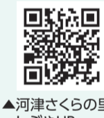
▲河津さくらの里しぶやHP