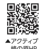
▲アクティブ峰の原HP

画 6月3日(土)・4日(日)(1泊2日) 画 アクティブ峰の原(長野県須坂市) ※現地集合・解散 上田駅からの送迎あり 画 区内在住、在勤、在学の人 画 2,000円(昼食代・保険料含む) ※交通費・宿泊費別途 画 40人(抽選) 画 5月3～9日に電話またはアクティブ峰の原HPで 画 アクティブ峰の原(峰の原青少年山の家) ☎0268-74-3179 ☎0268-74-3178