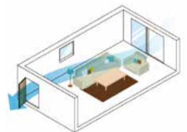
(東京都自宅療養者向けハンドブックより)