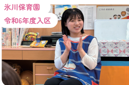
氷川保育園 令和6年度入区