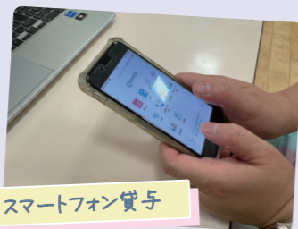
スマートフォン貸与