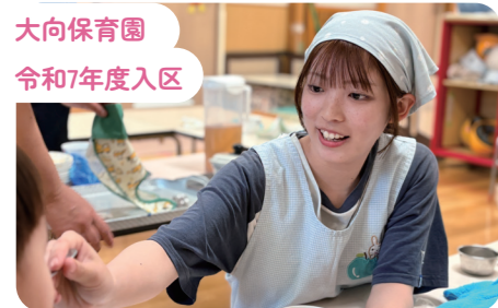
大向保育園 令和7年度入区