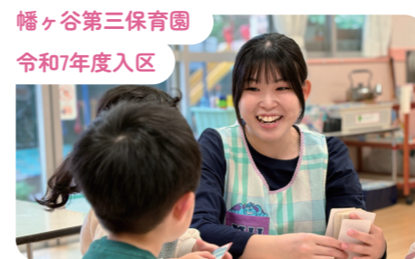
幡ヶ谷第三保育園 令和7年度入区