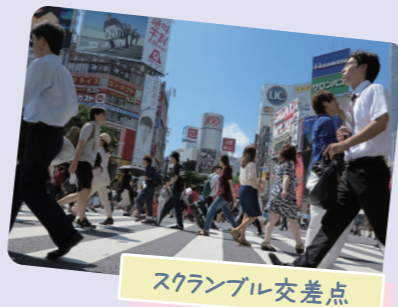
スクランブル交差点