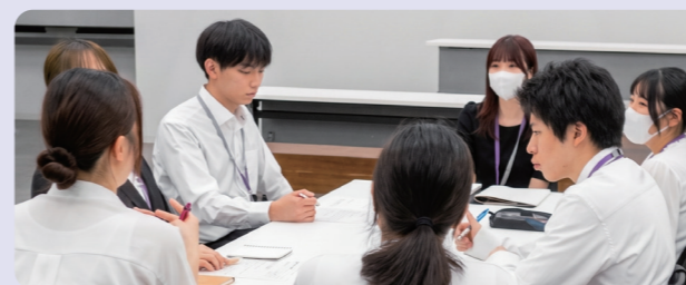
研修の例：新任研修、職層研修、担当別研修等