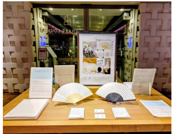
爽涼祭 POP アップ