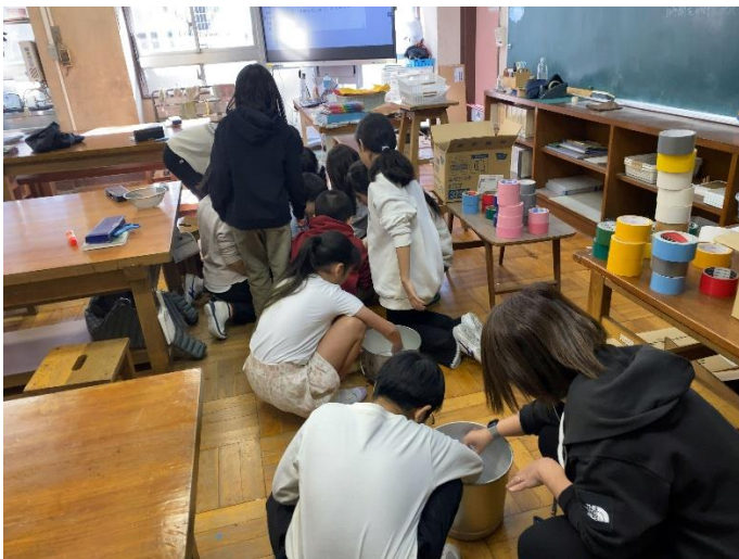
区立小学校の探求学習のゲストティーチャー