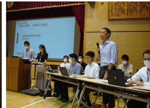
幡代小会場の様子