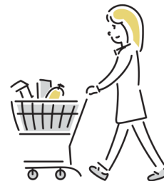
食材及び生活必需品の買い物