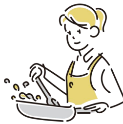
食事の準備、片付け