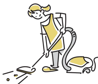
居室や水回りの掃除