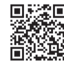
▲DIME Basketball School HP

関代官山スポーツプラザ 関TOKYO DIMEトレーナー 関各15人(抽選) 関月4,000円 ※入会金5,000円(Tシャツ、保険料含む) 関室内シューズ ※ウエア・シューズのレンタルあり(500円) 関5月8日までにDIME Basketball School HPで 関TOKYO DIME運営事務局 ✉dimebasketballschoo@gmail.com