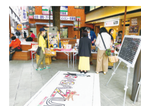
けやき広場での販売の様子