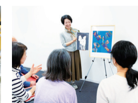
対話型アート鑑賞の様子

問(一社)シブヤフォント ☎03-6910-8960 ✉info@shibuyafont.jp