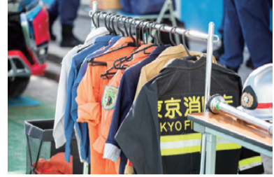
▲消防士の防火衣体験