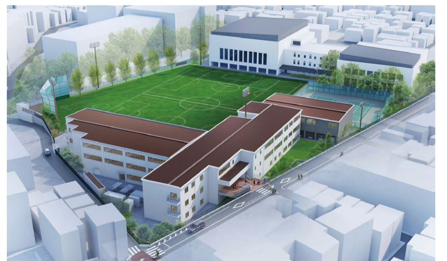
※パースはイメージであり、今後変更となる場合があります。

また、青山キャンパスでは、広尾中学校、松濤中学校に続き、神南小学校が移転することで、小中学生が一緒に学ぶ、より豊かな教育環境となります。小学生にとっては初めての仮設校舎での学校生活となることから、スクールバスの運行など、児童が安心して通学できる体制を万全に整えてまいります。