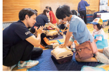
▲AEDを使ったレスキュー体験

消防士の防火衣体験やAEDを使ったレスキュー体験など、災害発生時に役に立つ防災力を身に付けることができます。