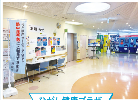
ひがし健康プラザ