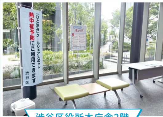
渋谷区役所本庁舎2階