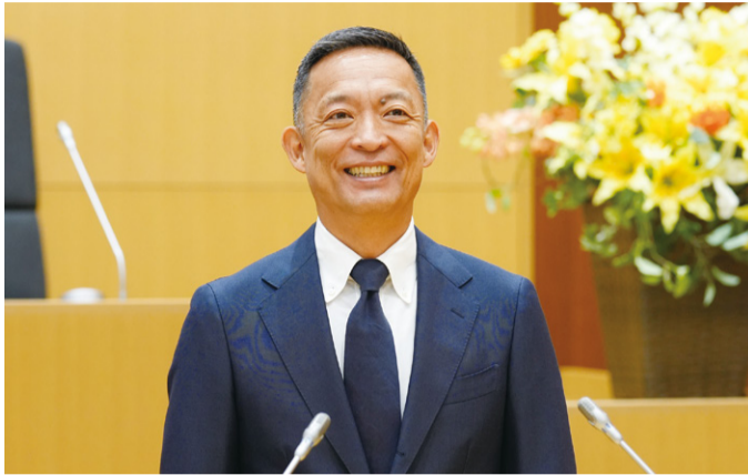
▲令和8年第2回区議会定例会