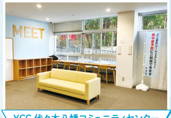
YCC 代々木八幡コミュニティセンター