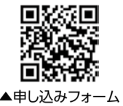
▲申し込みフォーム

■11月12日(消印有効)までに往復はがき(6ペーヅ)必要事項のほか生年月日を記入)で、〒150-0031桜丘町23-21文化総合センター大和田2階シニアいきいき大学へ、または申し込みフォームから ※詳しくは、募集要項(出張所、区民会館、スポーツ施設などで配布、シニアいきいき大学HPでダウンロード可)をご覧ください。 ■シニアいきいき大学 ☎03-3464-5171 ☎03-3464-5172