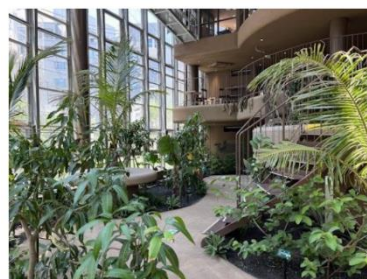
渋谷区ふれあい植物センター