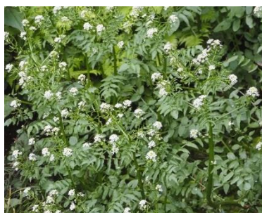
クレソン（オランダガラシ）